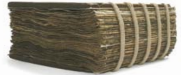
Möðruvallabók (AM 132 fol) fra midten av 1300-tallet er det største av de bevarte håndskriftene som inneholder islendingesagaer. Det inneholder 11 sagaer, bl.a. Njáls saga, Sagaen om Egil Skallagrimsson og Sagaen om laksdølene. Boken er innbundet i permer av tre, noe som var vanlig i middelalderen.

Håndskriftene fra Árni Magnússons samling danner kjernen i håndskriftsamlingen i Árni Magnússons institutt for islandske studier i Reykjavik. De ble overlevert fra Danmark til Island i årene 1971-1997, som følge av en avtale som ble inngått mellom de to landene som avslutning på den såkalte håndskriftsaken, som hadde pågått i en årrekke. Uenigheten gjaldt om de islandske håndskriftene skulle overleveres til Island eller forbli i Danmark. I tillegg til håndskrifter fra Árni Magnússons samling, fikk islendingene mange håndskrifter fra Det Kongelige Bibliotek i København. Det er også oppbevart flere andre håndskrifter på instituttet, f.eks. Skarösbók postulasagna (legender om apostlene), som med hjelp fra islandske banker ble kjøpt på auksjon i London i 1965- og gitt i gave til det islandske folk.